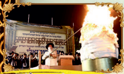
שבתות בשמן בהלקת מו"ד - 260 טלפון

ע"י מו"ד הגאון המקובל רבינו בנימין שמואל'י שליט"א