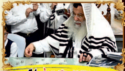
בדיקת נפש המיוחד + חיי דומם - 54 טלפון