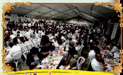
בנין ארץ ישראל - 54 טלפון