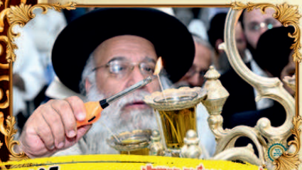
הלקחת פטמלת הושב"ל במסגרת מוקדמת - 807 טלפון