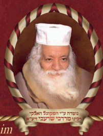
ניסוח נ"י המוסד העליון בניית סדרים שרונים י"א