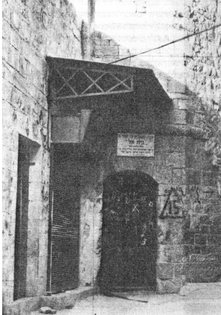
תמונת ישיבת בית אל בעיר העתיקה

באהבה רבה ובחרדת קדש היה ר' שלום משמש לפני המקובלים, בהגישו לפניהם את ספלי הקהוי [הקפה] השחורה באותם הלילות. האויר אשר נשם שם אז לקרבנו, אויר מבושם בקדש הקדשים, כנשימה מחיי הנצחיים. כה היה מתמיד הרש"ש ז"ל במשך זמן מה בימים ההם ובזמן ההוא.