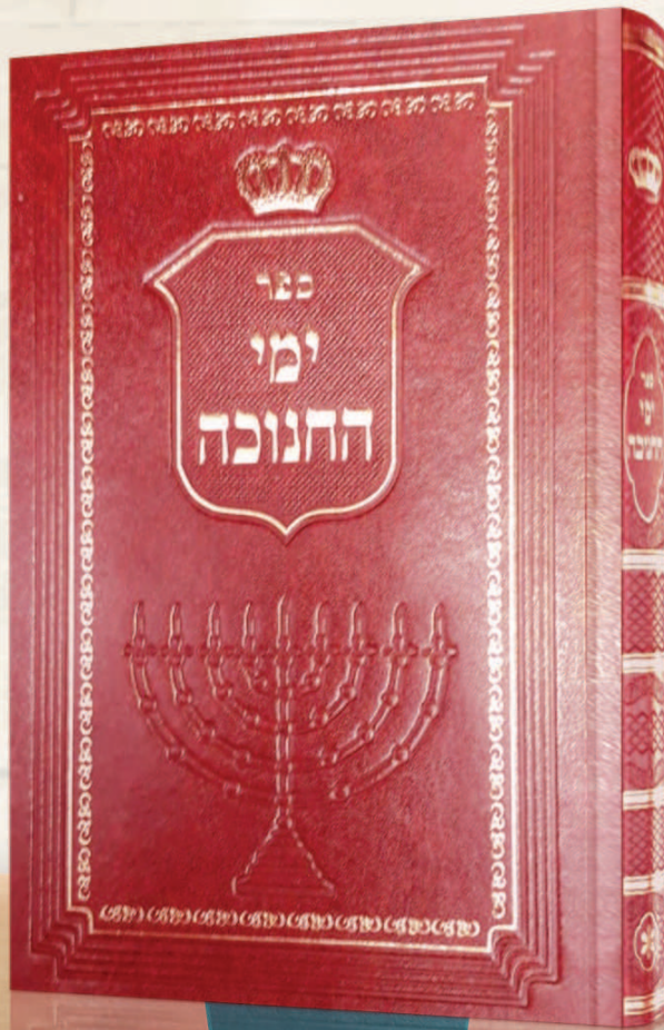
ספר ימי החנוכה