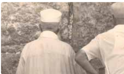
בתפילה בכותל המערבי