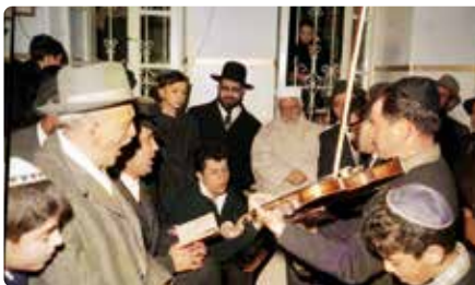
מו"ר עם מרן שר התורה רבי עובדיה זצ"ל