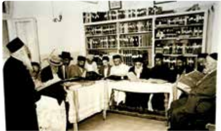
חכמי פורת יוסף עם הרב שרעבי