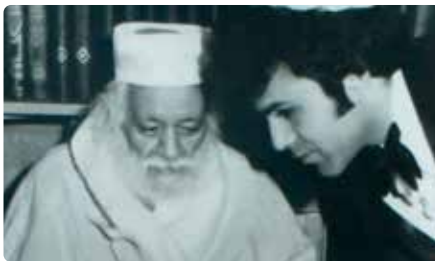
הרב בקבלת קהל