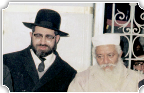
עם מרן הרב עובדיה יוסף זצוק"ל