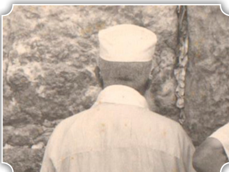
בתפילה בכותל המערבי