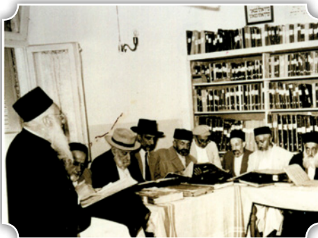
עם חכמי פורת יוסף