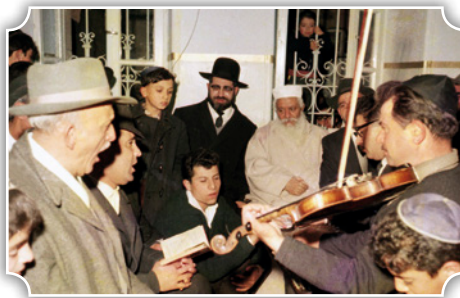
בשירת הבקשות בבית הכנסת אוהבי ציון